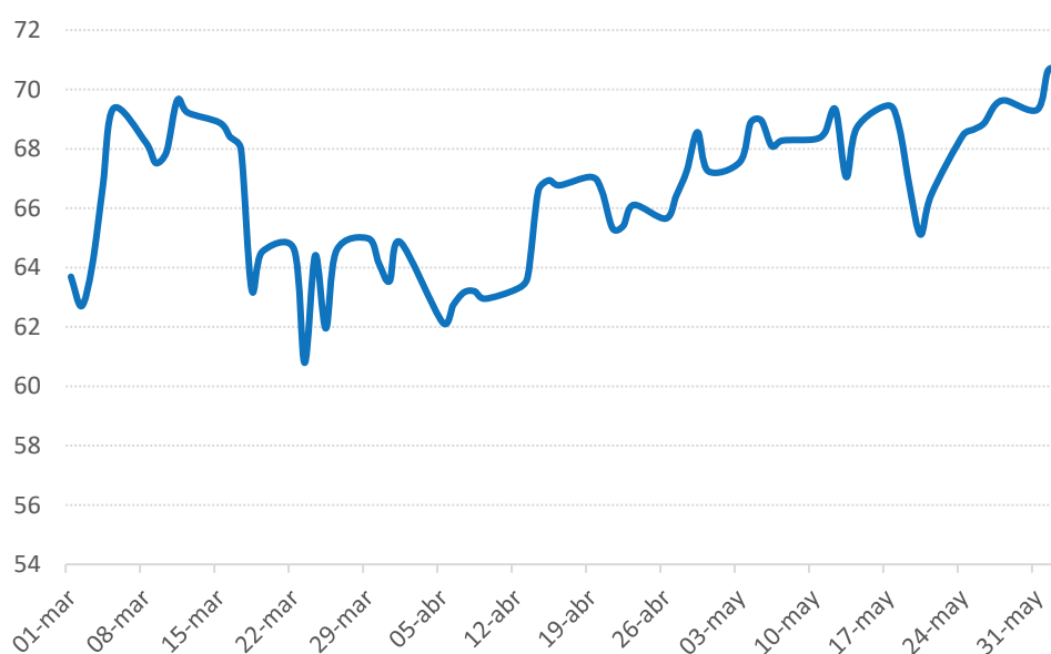
Evolución del precio de petróleo Brent (USD por barril)

Una preocupación que se desprende de esta evolución es el impacto sobre la inflación global que pareciera estar aumentando sus niveles en los últimos meses. La suba del petróleo, en conjunto con los aumentos en otros commodities, suman una nueva presión sobre los precios y podrían obligar a los Bancos Centrales a reducir los estímulos monetarios.