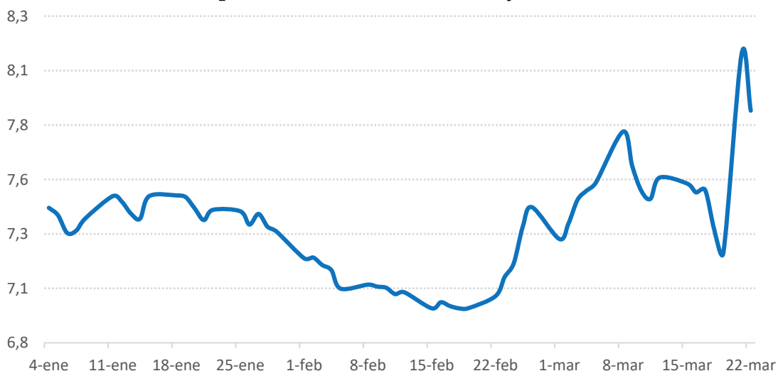
Evolución del tipo de cambio entre lira turca y dólar estadounidense

Esta depreciación podría desencadenar una nueva crisis para las empresas turcas altamente endeudadas en moneda extranjera. Se espera que en los próximos días el Banco Central sostenga la venta de divisas como mecanismo para frenar la caída de la lira turca y no inducir un nuevo rebrote inflacionario.