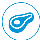
Carne y ganados