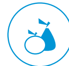
Peras y manzanas